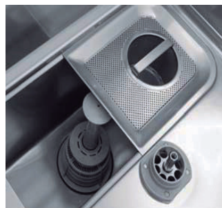
Cuba estampada doble filtro