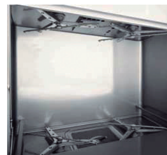
Óptimos sistema de lavado

Indispensable la instalación de descalcificador en aguas duras >15°dH