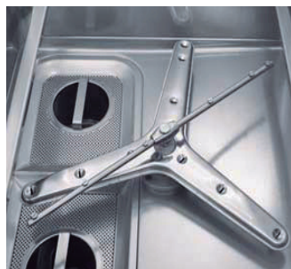
Sistema de aclarado.