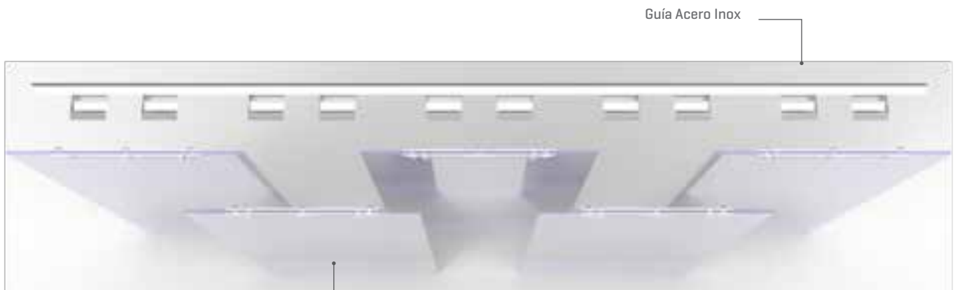
Lamas PVC colocación alterna