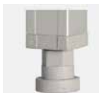
Pata regulable Adjustable leg