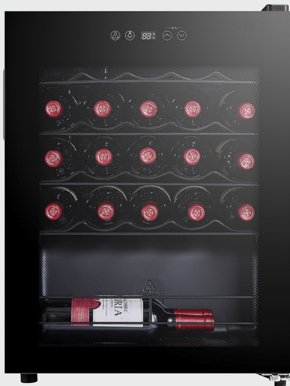
CAVISS - S124 MME4