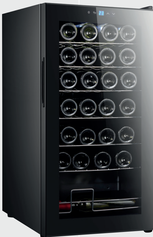
MENDOZA - 88 N