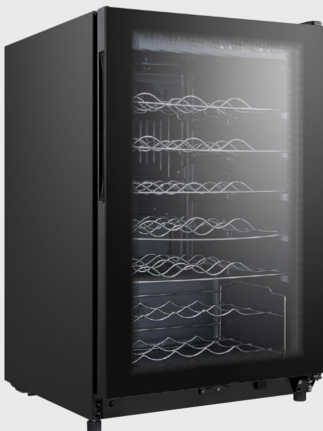
CAVISS - S145 MME4