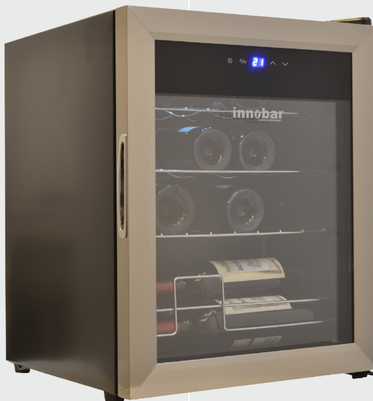
MENDOZA - 48 l