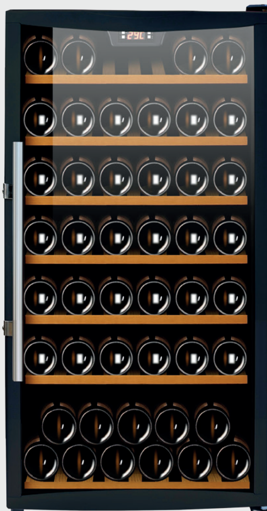
CAVISS - S178 GBE4