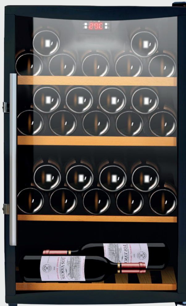
CAVISS - S130 GBE4