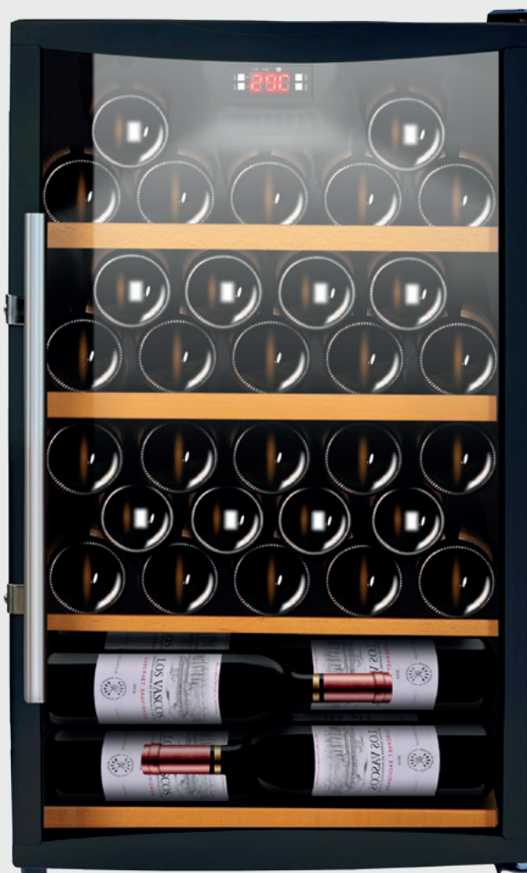
CAVISS - S150 GBE4