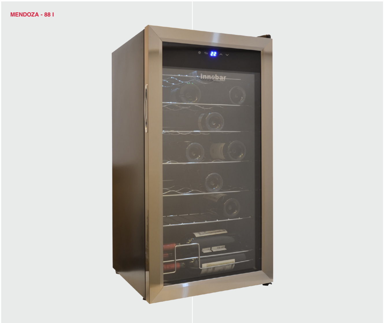
MENDOZA - 88 I