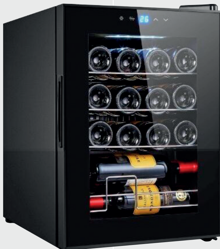
MENDOZA - 48 N